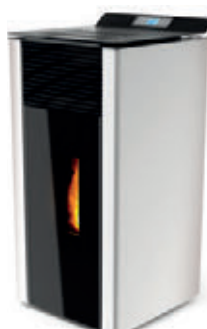
Blanco x = 7