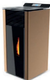
Bronce x = 5