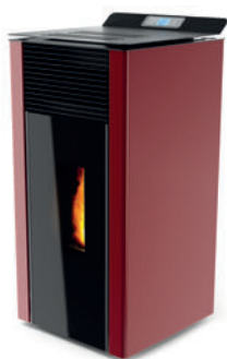
Rojo burdeos x = 1