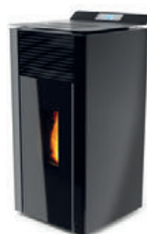
Negro x = 9

*Para hacer el pedido, sustituya la "X" en el código de la tabla inferior por la referencia del acabado deseado.