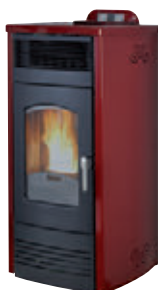
Rojo burdeos x = 1