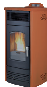
Cuero x = 6