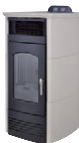
Marfil x = 2