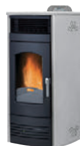
Inoxidable x = 5