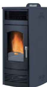
Antracita x = 3