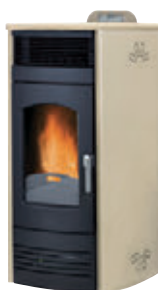
Marfil x = 2