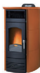
Ocre x = 9

*Para hacer el pedido, sustituya la "X" en el código de la tabla inferior por la referencia del acabado deseado.