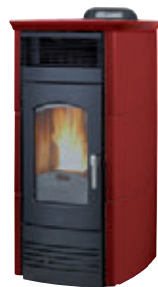
Rojo burdeos x = 1