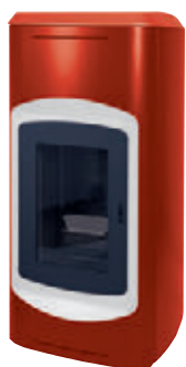
Rojo / Blanco x = 1