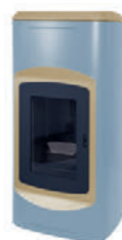
Aguamarina / Champagne x = 6

*Para hacer el pedido, sustituya la "X" en el código de la tabla inferior por la referencia del acabado deseado.