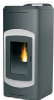
Antracita / Blanco x = 3