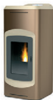
Bronce / Champagne x = 5