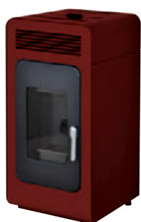
Rojo burdeos x = 1