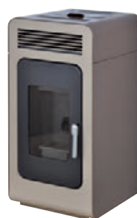
Marrón x = 7