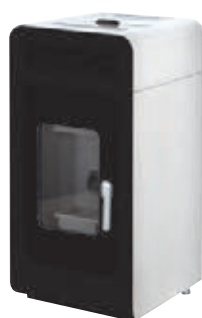
Blanco x = 3