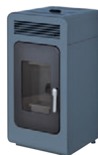
Azul x = 8

*Para hacer el pedido, sustituya la "X" en el código de la tabla inferior por la referencia del acabado deseado.