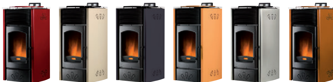
Rojo burdeos x = 1