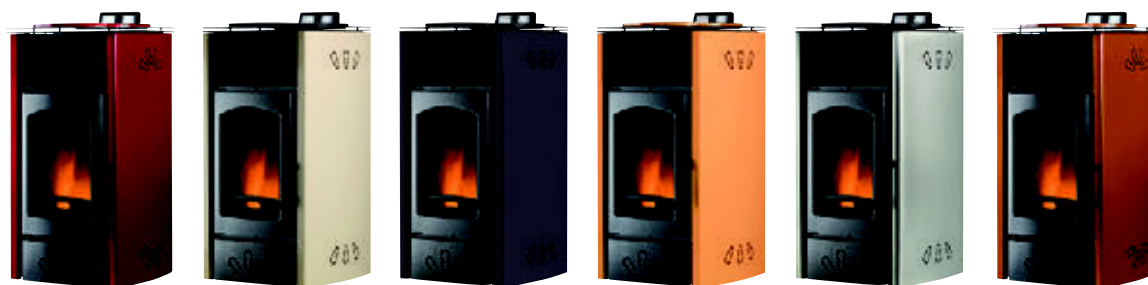
Rojo burdeos x = 1