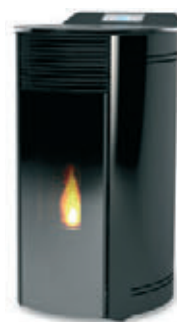
Negro x = 9

*Para hacer el pedido, sustituya la "X" en el código de la tabla inferior por la referencia del acabado deseado.