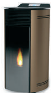
Bronce x = 5