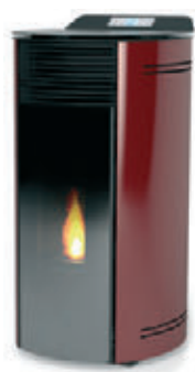
Rojo burdeos x = 1