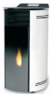
Blanco x = 7