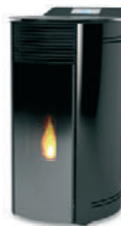
Negro x = 9

*Para hacer el pedido, sustituya la "X" en el código de la tabla inferior por la referencia del acabado deseado.