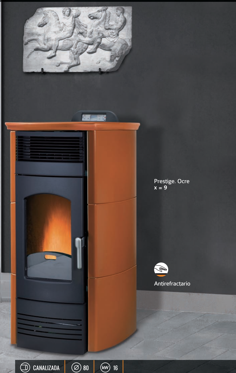
Prestige. Ocre x = 9