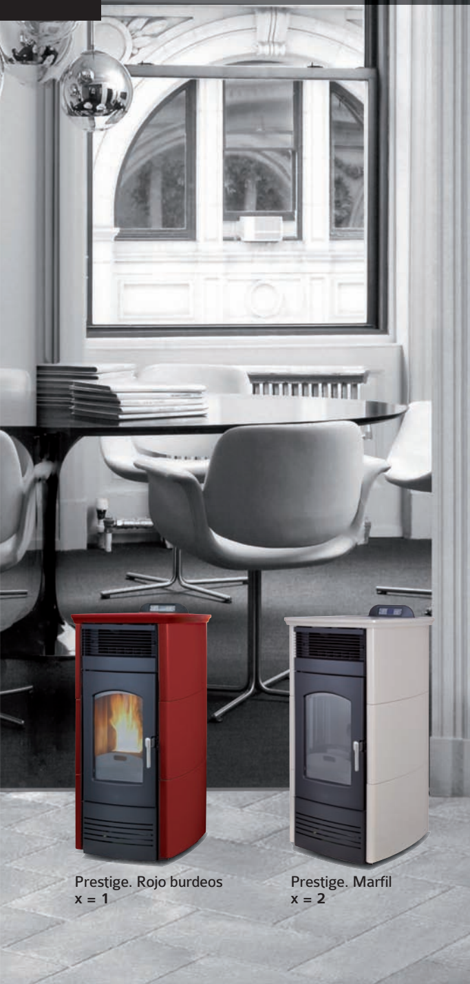
Prestige. Rojo burdeos x = 1