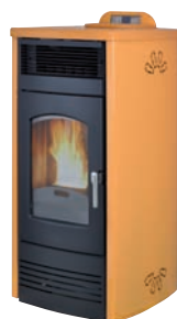
Plus. Salmón x = 4