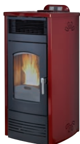
Plus. Rojo burdeos x = 1