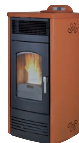
Plus. Cuero x = 6