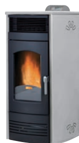
Plus. Inoxidable x = 5