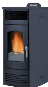
Plus. Antracita x = 3