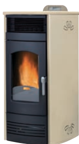
Plus. Marfil x = 2