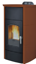
Ocre x = 9

*Para hacer el pedido, sustituya la "X" en el código de la tabla inferior por la referencia del acabado deseado.