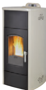
Marfil x = 2