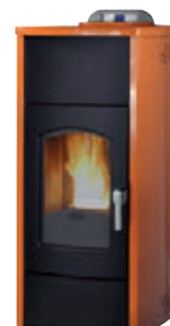
Cuero x = 6