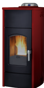
Rojo burdeos x = 1