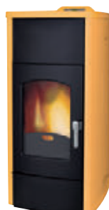
Salmón x = 4