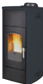
Antracita x = 3