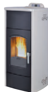
Plata x = 5