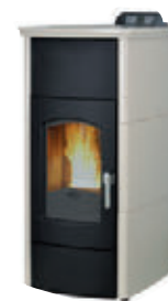
Marfil x = 2