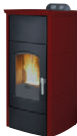
Rojo burdeos x = 1