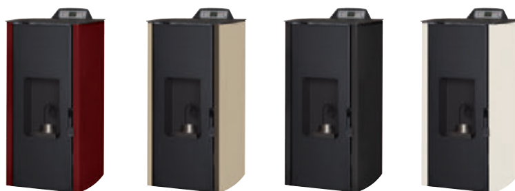
Rojo burdeos x = 1