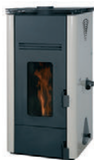
Blanco x = 2