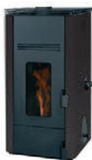
Antracita x = 3