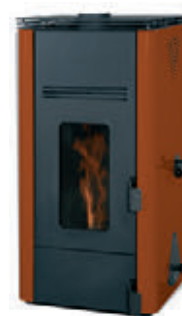
Cuero x = 6

*Para hacer el pedido, sustituya la "X" en el código de la tabla inferior por la referencia del acabado deseado.