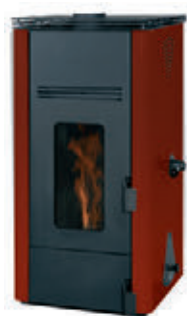
Rojo burdeos x = 1