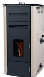
Marfil x = 4