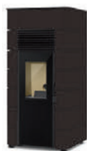
Negro x = 6