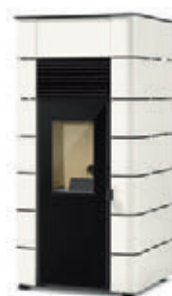
Blanco x = 7

*Para hacer el pedido, sustituya la "X" en el código de la tabla inferior por la referencia del acabado deseado.