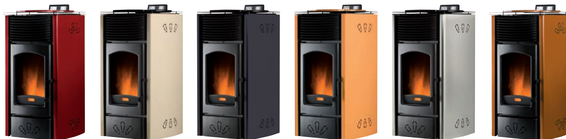
Rojo burdeos x = 1