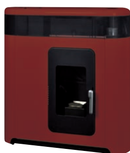
Rojo x = 1