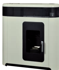
Marfil x = 2

*Para hacer el pedido, sustituya la "X" en el código de la tabla inferior por la referencia del acabado deseado.