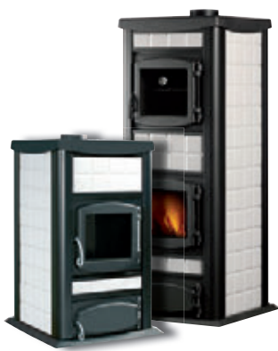
Blanco x = 2