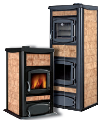
Madera x = 7

*Para hacer el pedido, sustituya la "X" en el código de la tabla inferior por la referencia del acabado deseado.