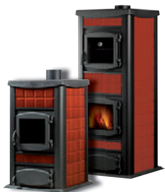
Rojo x = 1