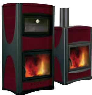
Rojo Burdeos x = 1