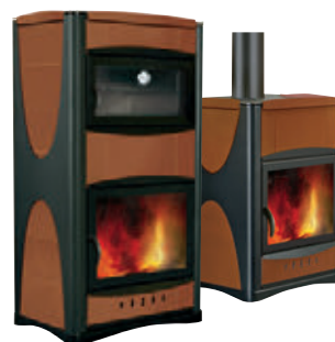
Ocre x = 9

*Para hacer el pedido, sustituya la "X" en el código de la tabla inferior por la referencia del acabado deseado.