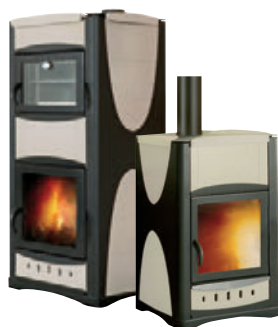
Marfil x = 2